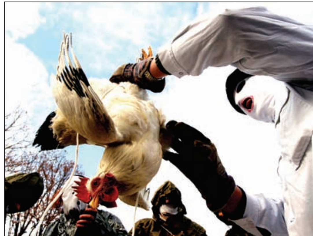
Bulgaronan bisti cu pañanan protector ta hunga cu un gai, durante un show, contra enfermedad di parha den e pueblo Lesnovo, 30 km di e capital Sofia. Tur invierno miles di homber for di e pueblo di Bulgaria, bisti cu mascarada y paña traha di cuero di animal, ta tuma parti na e celebracionnan tradicional, pa trece bon salu y fertilidad.

E prome dia di e huicio, cu a wordo pospone den varios ocasion, lo ta dedica na e seleccion di e hurado y corte lo cuminsa diamars of diaranson. E Britaniconan ta vigilando e mesquita for di un tempo, pero nunca a pasa nada suficiente grave pa permiti pa nan actua.